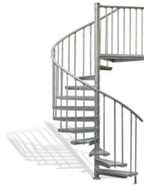
Ø 182 cm 12 Stg. ab 1.899,- €*