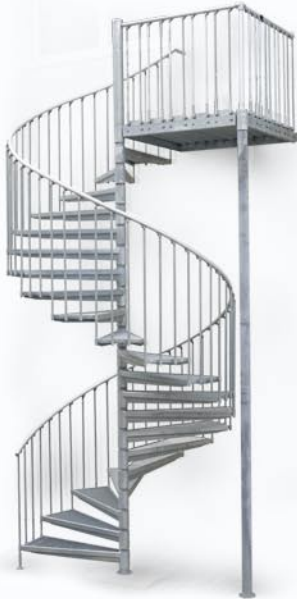
Treppe 182 cm 22 Stg. ab 3.888,- €*

Bausatztreppe ab 6 Stufen bis 30 Steigungen, max. GH bis 600 cm. Fertige Stufenmodule mit Geländersegment und Podest Dreieckform, Brüstungsgeländer und durchgehende Zentralsäule, inkl. aller Beschläge. Standrohr zur Treppe ist stellbar z.B. auf einem Beton Fundament.