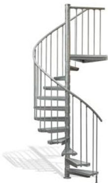
Ø 137 cm 12 Stg. ab 1.299,- €*