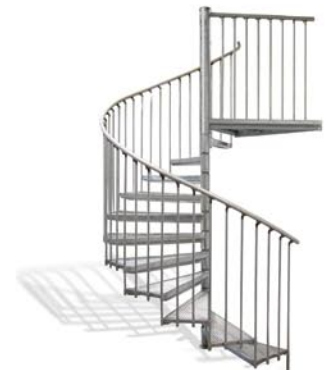
Ø 222 cm 12 Stg. ab 2.599,- €*