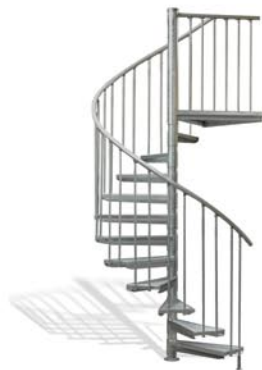
Ø 166 cm 12 Stg. ab 1.499,- €*