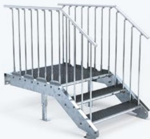
Podest-Treppe 100 cm 3 Stg. ab 1.605,- €*