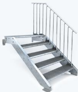
Treppe 80 cm, Antritt 5 Stg. ab 742,- €*